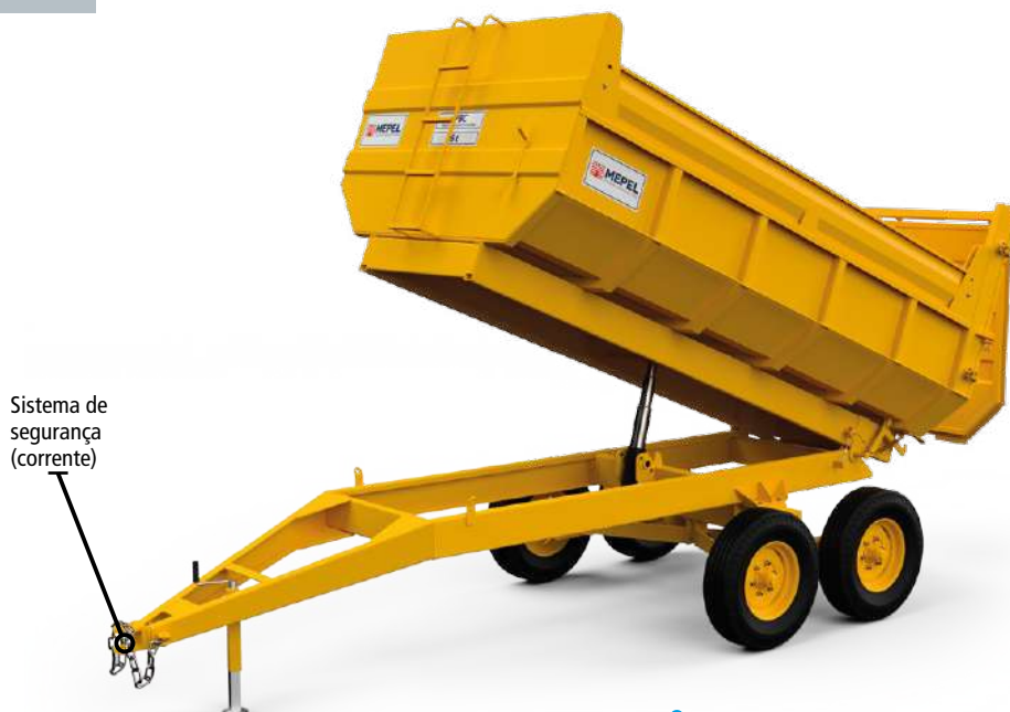
VBC 6 t 6 m³ Tandem aro "16