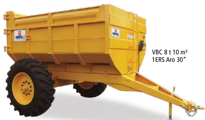
VBC 8 t 10 m 3 1ERS Aro 30"