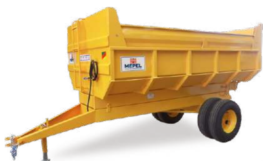
VBC 4 t 6 m 3 1ERD Aro 16"