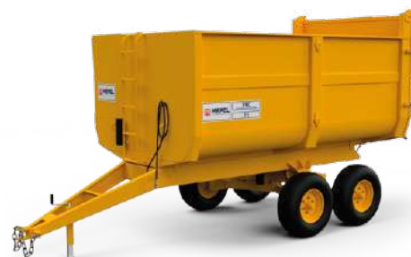
VBC 7 t 9 m 3 Modulado Tandem Aro 15"

*ABB: Abertura Basculante | ABL: Abertura Lateral