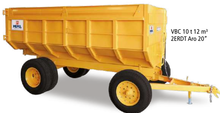
VBC 10 t 12 m 3 2ERDT Aro 20"