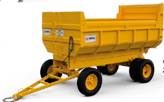
VBC 6 t 6 m 3 2ERDT Aro 16"