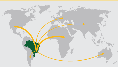
DO BRASIL PARA MAIS DE 50 PAÍSES