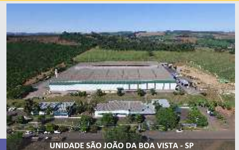
UNIDADE SÃO JOÃO DA BOA VISTA - SP

Linha de Mixers JF, a solução para o produtor!