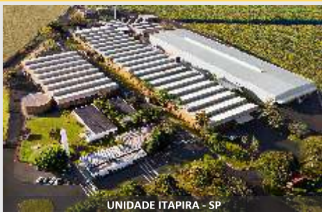
UNIDADE ITAPIRA - SP

Alimentação balanceada do primeiro ao último animal!