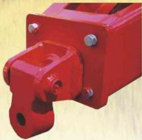
Engate, do cabeçalho à barra de tração, articulado - especial para terrenos com muitas saliências ou depressões como a lavoura arrozeira.