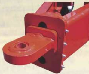
Cabeçalho com amplitude de regulagem de altura de acoplamento de 150mm. - Permite altura de engate ao solo de 420/470/520 ou 570mm