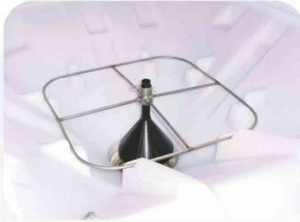
Suporte Funil para arroz Pré-germinado