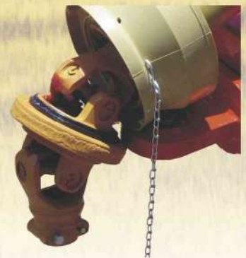
Cardan com proteção homocinético, com grande angularidade.