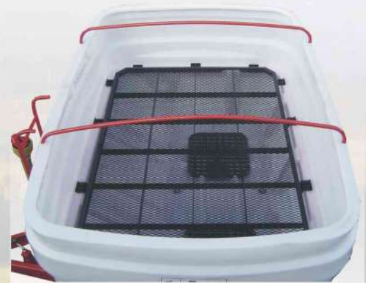
Grade de proteção- para evitar que os torrões de adubo obstruam o fluxo de saída.