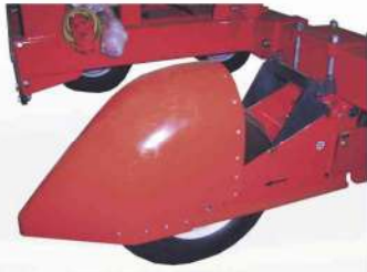
Kit Limpa Trilho- Evita danos a planta.